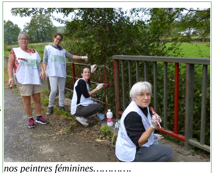
nos peintres féminines.....