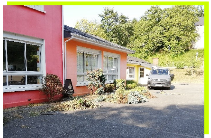
nettoyage des bordures, et des arbustes