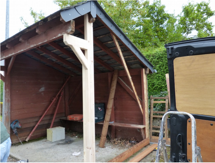
ABRI-BUS entrée du village