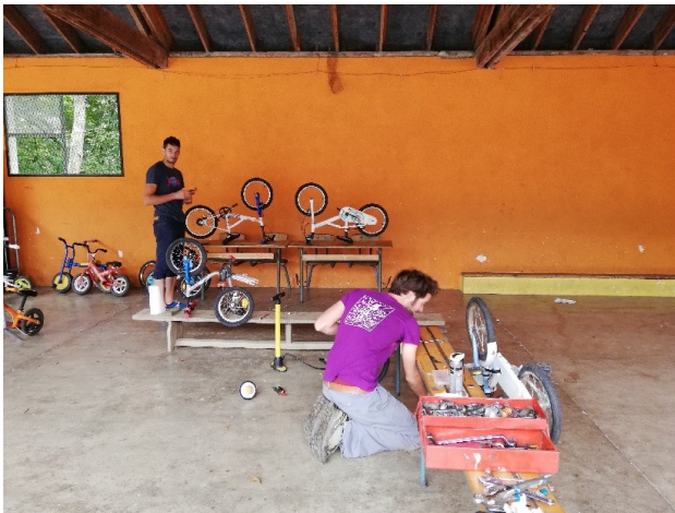
entretien des vélos, merci aux mécanos.....