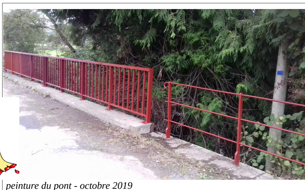
peinture du pont - octobre 2019