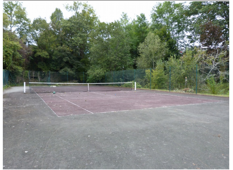
Terrain de Tennis