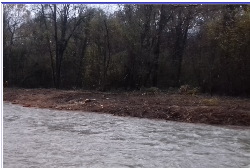
l'île nettoyée - novembre 2019