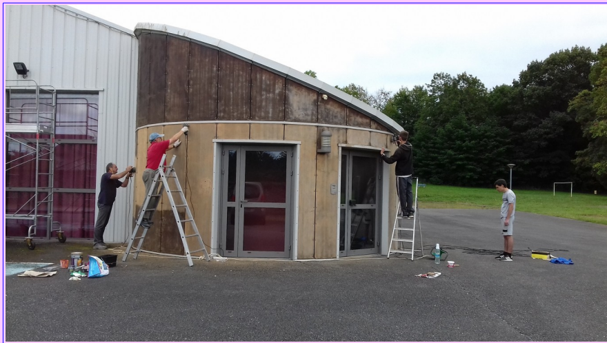
SALLE BEZIAT : Ponçage et peintures